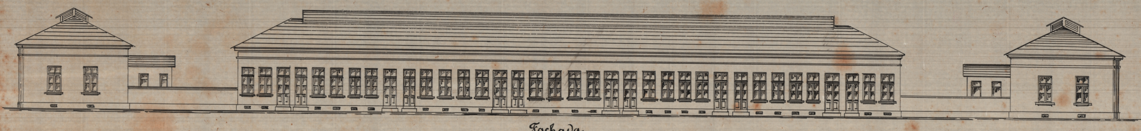
Fachada Escala 1:200

Companhia de Saneamento do Rio de Janeiro O Presidente Arthur Ramos