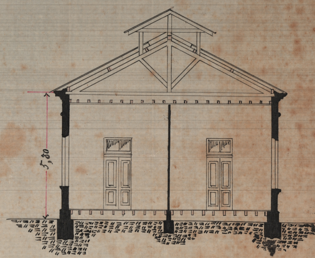
Corte Escala 1:100