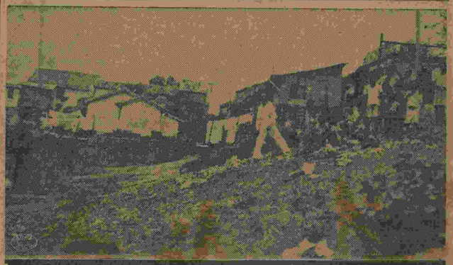
Um aspecto desolador da miseria no Morro da Mangueira