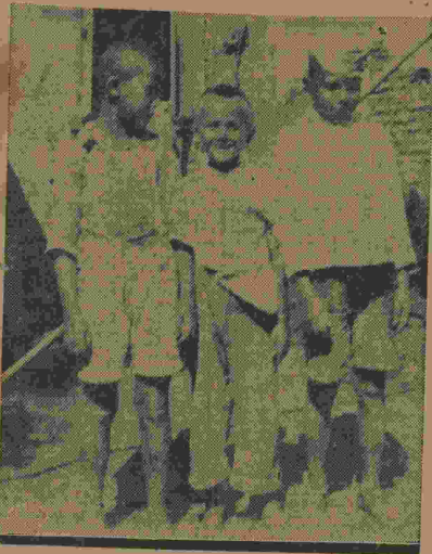
Pequenos e inconscientes vagabundos colhidos pela nossa objetiva

Quem andar o Rio, de ponta a ponta, com olhos de ver, deparará, sem que a possa evitar, com um quadro impressionantemente deplorável: crianças, de centenas, de milhares, em idade escolar, perambulando pelas ruas,