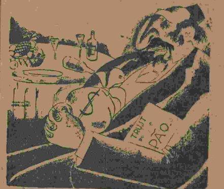
Bunge & Born, os judeus do trigo

A INDUSTRIA DA MOAGEM ENRIQUECE OS JUDEUS BUNGE & BORN E OUTROS, PREJUDICANDO ENORMEMENTE O BRASIL