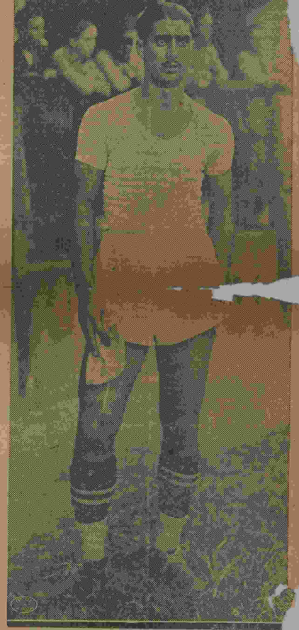
Caxambu', fará sua estréa no prelio de hoje