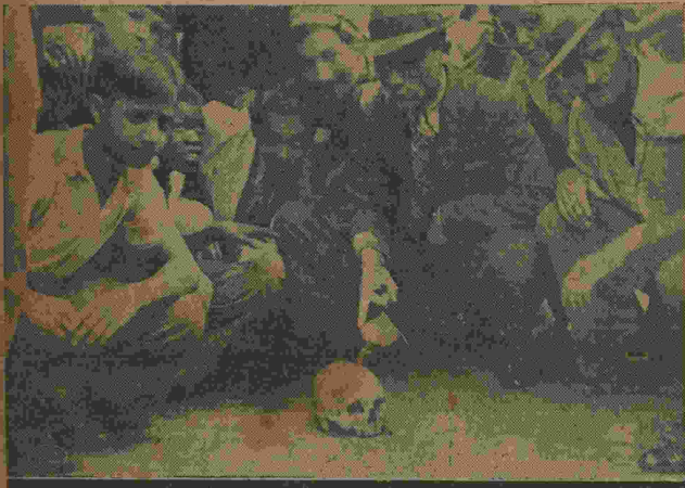
Populares em torno da caveira que appareceu na Av. Gomes Freire

APARECEU, MYSTERIOSAMENTE, NA AVENIDA GOMES FREIRE E INTERROMPEU O TRANSITO NAQUELLA VIA PUBLICA